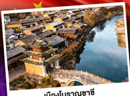
เมืองโบราณชาซี

ชมดอกไม้บานสะพรั่งทั่วขุนนาน "เซ็ดอี่แฉดาเฟ้ววี่สุดอลัง"