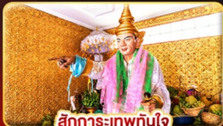
สิทธิการะเทพทันใจ