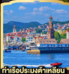
ท่าเรือประมงต้าเหลียน