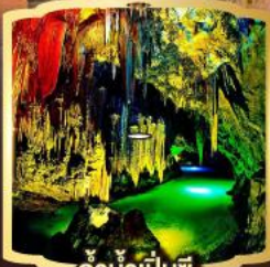
ถ้ำน้ำเป็นซี