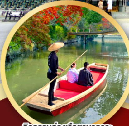
กิจกรรมล่องเรือยามากาวะ