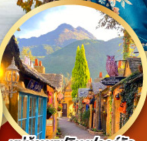
หมู่บ้านยูฟูอิน ฟลอร์ริล