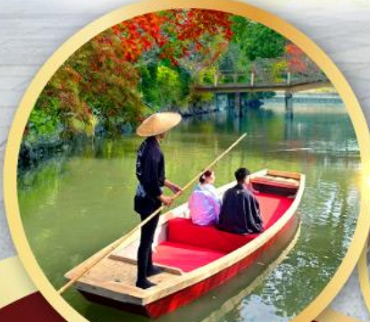
กิจกรรมล่องเรือยามากาวะ