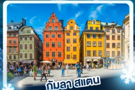
กับลาฮเตน