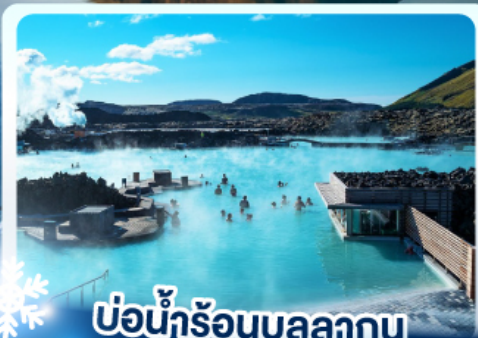
♨️ แช่น้ำร้อนบลูลากูน

เก็บไอซ์แลนด์ เดนบูเงาไฟร์คิร์กจูเฟล และ แช่น้ำร้อนบลูลากูน