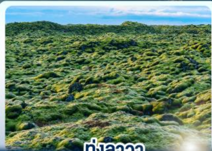
ทุ่งลาวา