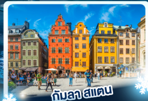
🏘️ กับลา สแตน