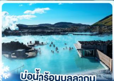
แช่น้ำร้อนบลูลากูน

เก็บไอซ์แลนด์ แดนภูเขาไฟคิรูกูเฟล และ แช่น้ำร้อนบลูลากูน