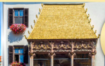
หลังคาทองคำอินน์สบูร์ค