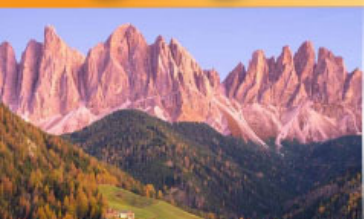
อุทยานแห่งชาติโดโลไมท์