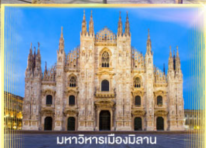
มหาวิหารเมืองมิลาน