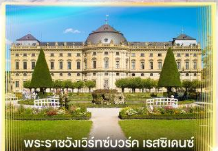
พระราชวังเวิร์ทซ์บวร์ค เรสซิเดนซ์