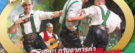
พิเศษ!! ทานอาหารค่ำ พร้อมชมการแสดงดนตรีพื้นเมืองสไตล์โรเลียน และเยือนเมืองอูเทรคต์ สีสันใหม่เนเธอร์แลนด์

ไฮไลท์ในโปรแกรม • เยือนเมืองแห่งแคว้นบาวาเรีย และ ทิโรล • สุกสนานเหมืองเกลือเบิร์ชเทสกาเดิน • เข้าชมปราสาทนอยชวานสไตน์ • เดินเล่นจัตุรัสโรเมอร์ ซอปปิง Zeil Street • ถ่ายรูปมุมสวยของหมู่บ้านอัลสติก • ซิลลา ไปในเมืองซาลสบูร์ก บ้านเกิดโมสาร์ท 25 ก.ย. - 04 ต.ค. 69 • ล่องเรือหมู่บ้านทีธูร์น และ ล่องเรือชมนครอัมสเตอร์ดัม 09-18, 16-25 ต.ค. 69 • ซอปปิงจุใจย่านดิมสแควร์และเดินเล่นย่านโคมแดง 22-31 ต.ค. 69 / 06-15 พ.ย. 69 GO3MUC-TG032 29 ธ.ค. 69 - 07 ม.ค. 70 * ปีใหม่ *