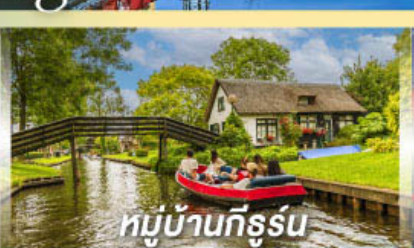
หมู่บ้านทีร์รูน