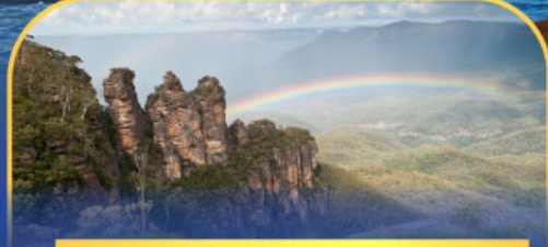
อุทยานแห่งชาติบลูเมาท์เทนส์ Three Sister Rock