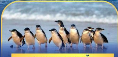
พาเหรดนกเพนกวิน