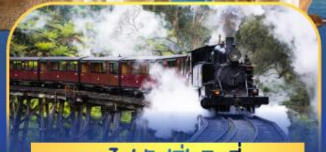
รถไฟพuffingบิลลี่

ล่องเรือชมอ่าวซิดนีย์พร้อมรับประทานอาหารกลางวัน และ เข้าชมสวนสัตว์การองก้า