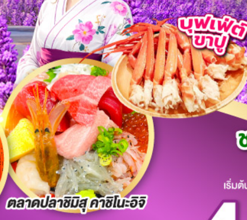
ตลาดปลาซิมิสึ คาชิโนะอิชิ