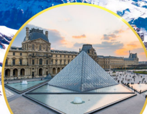
ถ่ายรูปคู่พีพีรกันที่ลูฟร์