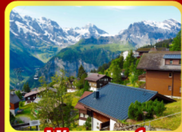
หมู่บ้านมอร์สเรน