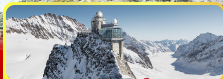
ยอดเทาจุงเฟรา