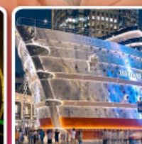
เรือหุหลู่