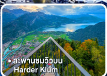
• สะพานชมวิวน Harder Klum