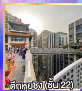
ตึกหุ่ยซิง (ชั้น 22)