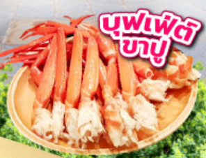
บุฟเฟต์ ภูเขา