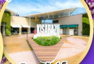
มิตซึยามะ เอ้าท์เล็ต พาร์ค คิซึระซึ