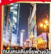
ถนนคนเดินเจียวฟางเป่ย์