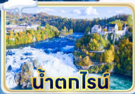
น้ำตกไรน์