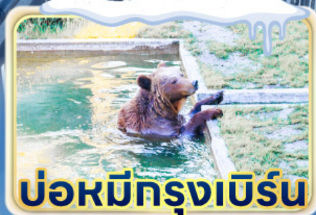
บ่อหมีกรุงเบิร์น