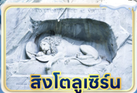
สิงโตลูเซิร์น