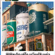
พิพิธภัณฑ์โรงเบียร์ซิงเต่า