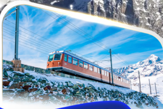
ขึ้นรถไฟฟันที่ฟ็องทอนนอร์เกรต