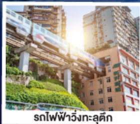
รถไฟฟ้าวิ่งทะลุคิก