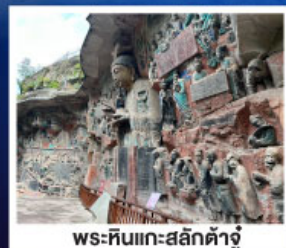
พระหินแกะสลักตัวจู้