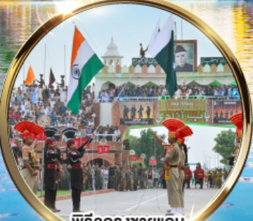
พิธีฉลองชายแดน อินเดีย-ปากีสถาน ค่ายวากาห์