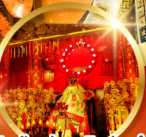
วัดเจ้าแม่กวนอิมอ่องอำ (สวนหนานเหลียน)