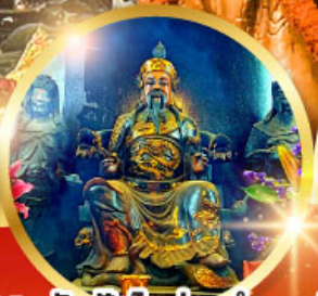
วัดปักโต้อ่องอำ