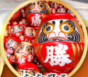
วัดคิตสึโองิ (วัดदारุมะ)

ชมความงามของกำแพงหิมะ เส้นทางสายอัลไพน์ ทาคายามา (JAPAN ALPS SNOW WALL)