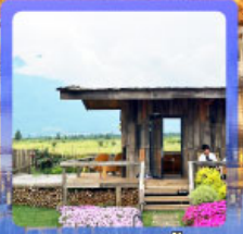
เมืองโบราณลี่เจียง หุบเขาพระจันทร์สีน้ำเงิน ร้านกาแฟหุบเขาคี๊อัน