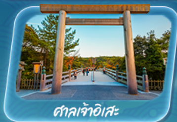
ศาลเจ้าอิสะ

12 - 17 พ.ค. 69 / 19 - 24 พ.ค. 69 26 - 31 พ.ค. 69 / 2 - 7 มิ.ย. 69 9 - 14 มิ.ย. 69