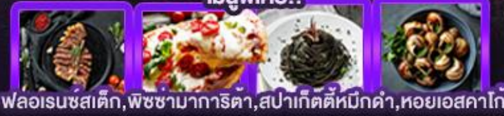
พลอเรนซสติก, พิชชามากาเร็ตา, สเปาเก็ตตีหมึกดำ, หอยเอสคาโท