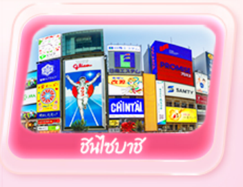
ชิโมซบาชิ