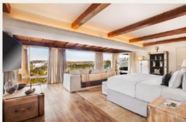
Gran Meliá Iguazú Argentina Side