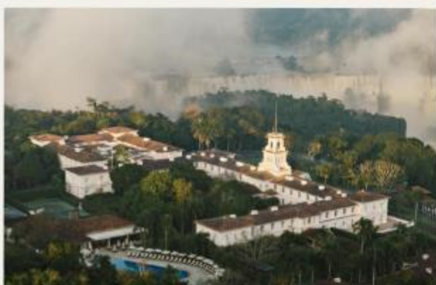
Hotel das Cataratas, A Belmond Hotel