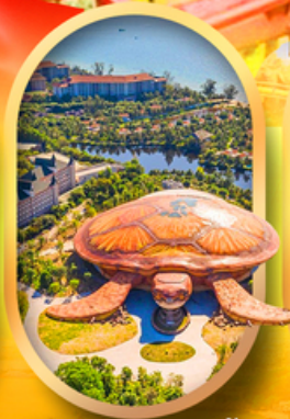
พิพิธภัณฑ์สัตว์น้ำ