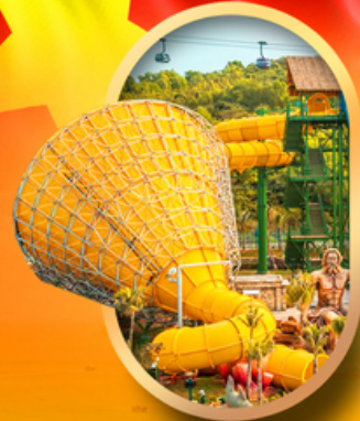
สวนน้ำ Hon Thom