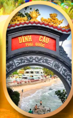
ศาลเจ้าดิงเกา