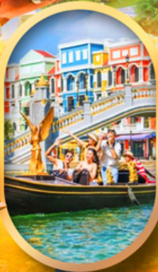
เอนิเมะแห่งเวียดนาม