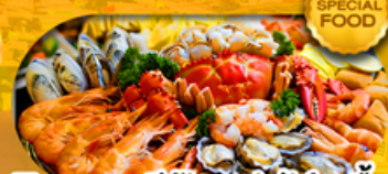
พิเศษเมนู ซิวัดบุฟเฟ่ต์ 1 มื้อ เดินทาง มีนาคม 2569