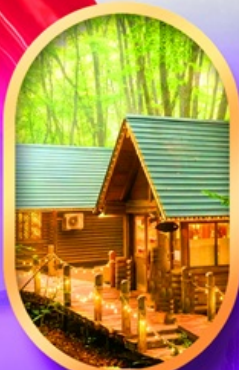
นิงเกิ้ลทอเรีย