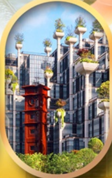
อาคารพินตันโบ