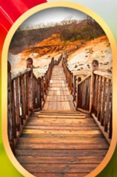
หุบเขาจิกอกุคาบิ