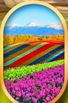
สวนดอกไม้ชิชิโซ