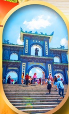
วัดหลินอิ่ง