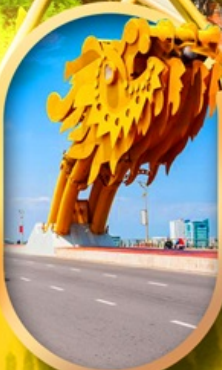
สะพานมังกรดานัง