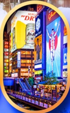
ย่านชินโซบาชิ