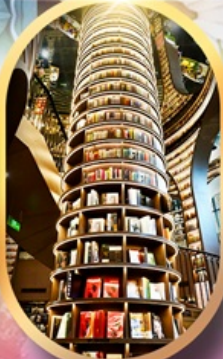
หอหนังสือจงซูเก้อ