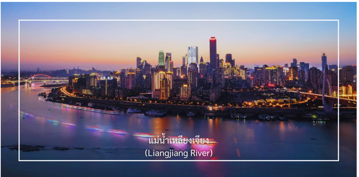
แม่น้ำเหลียงเจียง (Liangjiang River)

ล่องเรือม่านน้ำเหลียงเจียง (Liangjiang Cruise) พื้นที่จุดบรรจบของแม่น้ำทั้งสอง ซึ่งเป็นหนึ่งในมุมมองที่สวยงามที่สุดของเมืองฉงชิ่ง ซึ่งประกอบด้วย แม่น้ำแยงซี (Yangtze River) เป็นแม่น้ำสายที่ยาวที่สุดในจีน และเป็นสายหลัก แม่น้ำเจียงหลิง (Jialing River) แม่น้ำสาขาที่สำคัญซึ่งไหลลงสู่แม่น้ำแยงซี พื้นที่ที่แม่น้ำทั้งสองสายนี้มาบรรจบกันมีชื่อว่า “เหลียงเจียง” กิจกรรมล่องเรือสองแม่น้ำ (Two Rivers Cruise) ซึ่งได้รับความนิยม เพราะจะได้ชมเส้นขอบฟ้าของฉงชิ่งยามค่ำคืน ตึกระฟ้า แสงไฟเมือง เป็นเอกลักษณ์