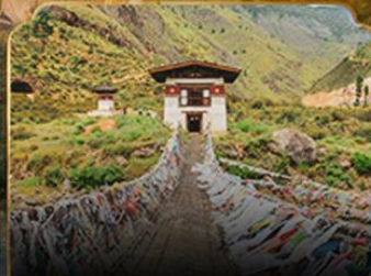
สะพานแขวนพุนาคา PUNAKA SUSPENSION BRIDGE