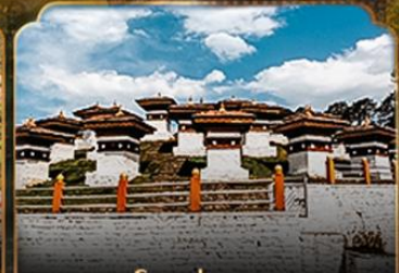
โดชูล่าพาส DOCHULA PASS