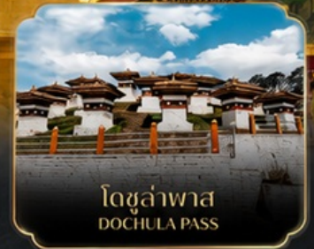
โดชูล่าพาส DOCHULA PASS