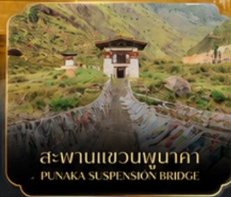
สะพานแขวนพุนาคา PUNAKA SUSPENSION BRIDGE