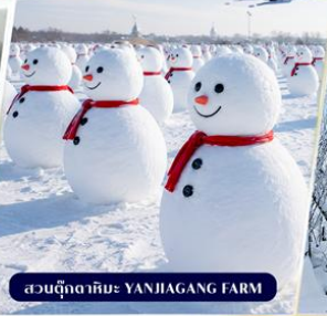
สวนตุ๊กตาหิมะ YANJIANG FARM