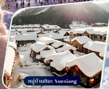
หมู่บ้านหิมะ Xuexiang

✈️ คอนเฟิร์มออกเดินทาง ตั้งแต่ 15 ท่าน ขึ้นไป