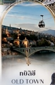
ทบิลีซี OLD TOWN