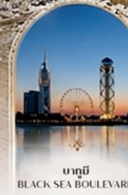
บาทุบี BLACK SEA BOULEVARD