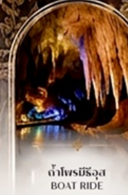
ดำโพรมิรัฐอส BOAT RIDE

เดินทางช่วงปีใหม่ 27 ธ.ค. - 3 ม.ค. 70 ราคาเพียง 75,989 บาท / ท่าน