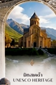
มิกสคด้า UNESCO HERITAGE