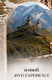
คาสเบกี 4WD EXPERIENCE