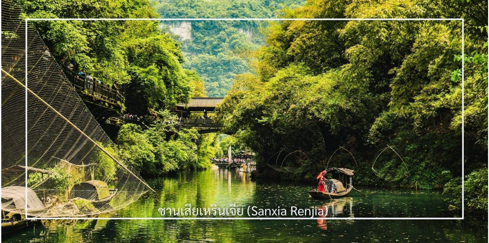
ซานเซียเหรินเจีย (Sanxia Renjia)

นำท่านสู่ หมู่บ้านซานเซียเหรินเจีย (Sanxia Renjia) (รวมล่องเรือ) สถานที่นี้เป็นที่รู้จักกันในชื่อ หมู่บ้านสามผา แหล่งท่องเที่ยวระดับ 5A ตั้งอยู่ในเขตหุบเขาสามผา ริมน้ำแยงซีเกียง โดดเด่นด้วยทัศนียภาพทางธรรมชาติอันงดงามของภูเขา หินผา สายน้ำ และหุบเขาที่โอบล้อมกันอย่างกลมกลืน สถานที่แห่งนี้สะท้อนวิถีชีวิตดั้งเดิมของชาวลุ่มแม่น้ำแยงซีเกียง ผ่านสถาปัตยกรรมพื้นบ้าน วัฒนธรรม ประเพณี ที่ยังคงเอกลักษณ์ไว้อย่างครบถ้วน พร้อมให้ท่านได้ชมการแสดงเรื่องราวเกี่ยวกับวิถีชีวิตควบคู่กับสายน้ำ