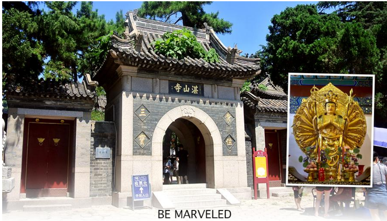
BE MARVELED วัดจ้านซาน

เมืองชิงเต่า สถานที่ที่สงบ และบรรยากาศภายในวัดที่ร่มรื่น ตั้งอยู่เหนือเนินเขาจากสวนสาธารณะ จงซาน ก่อตั้งในปี พ.ศ. 2477 เป็นวัดอายุน้อยที่สุดในนิกายเถียนไถของพุทธศาสนาจีน แต่โดดเด่น ด้วยสถาปัตยกรรมและคุณค่าทางวัฒนธรรม