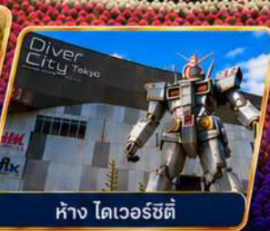
ห้าง ไดเวอร์ซิตี