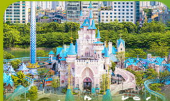
สวนสนุกแกมเบียเวิร์ล Lotte Adventure World