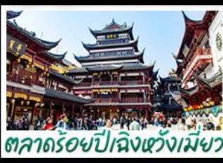
ตลาดร้อยปีเจียงหวงเมี่ย