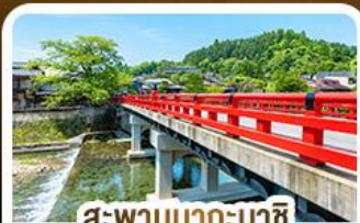
สะพานนากะบาชิจิ ทาคายาม่า