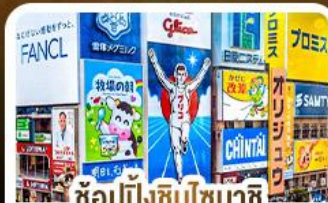
ช้อปปิ้งชินโซบาชิจิ และโดตงโบริ