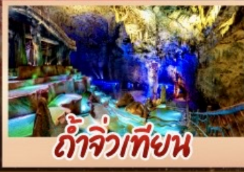
ถ้ำจิวเทียน