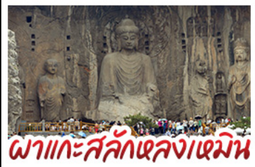
ภาพแกะสลักหลงเหมิน

เที่ยวครบ 4 มรดกโลก ถ้ำหลงเหมิน - สุสานจีนชื่อง่องเต้ - วัดเส้าหลิน หมู่บ้านใต้ดินสามโจ้ว - หมู่บ้านทิวาลัยชุน