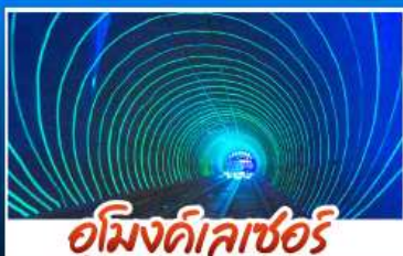
อูมิงดิลเลเซอร์